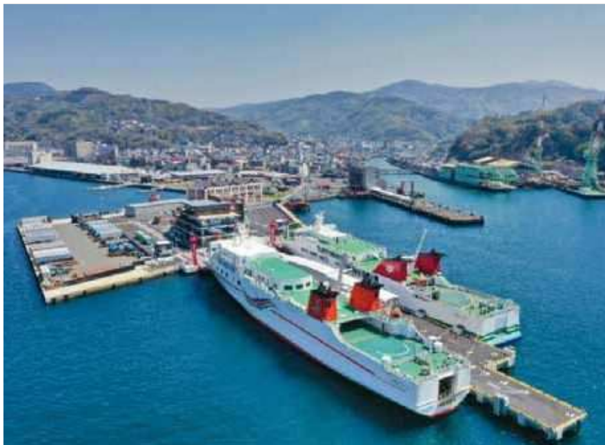
【新フェリーターミナル】

既存フェリー岸壁（水深5.5m）の老朽化や船舶の大型化、大規模地震発生時における緊急物資輸送に対応するため、八幡浜市によるフェリーふ頭再編事業として、平成27年度より新フェリー岸壁の整備が開始され、令和4年4月より供用が開始されました。