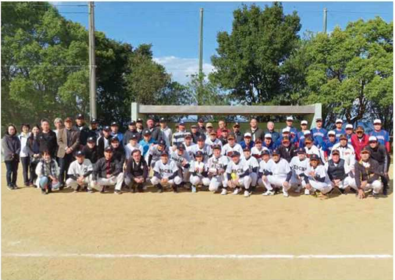
県別対抗ソフトボール大会

●発行人 / 浜崎 友二 ●編集人 / 秋山 千枝 ●ホームページ / https://www.shikoku-zei.or.jp