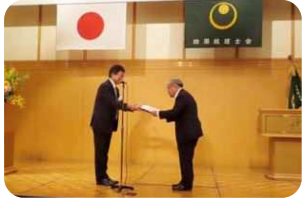
表彰状の授与（会員表彰）