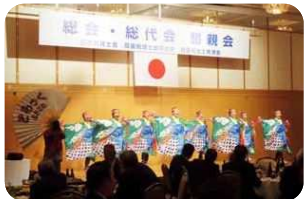
アトラクションは、恒例のよさこい