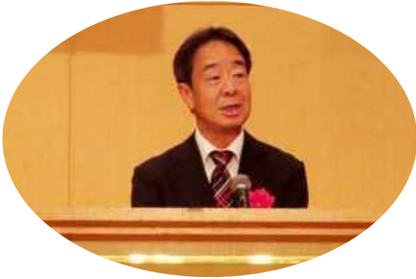
来賓祝辞 高松国税局長