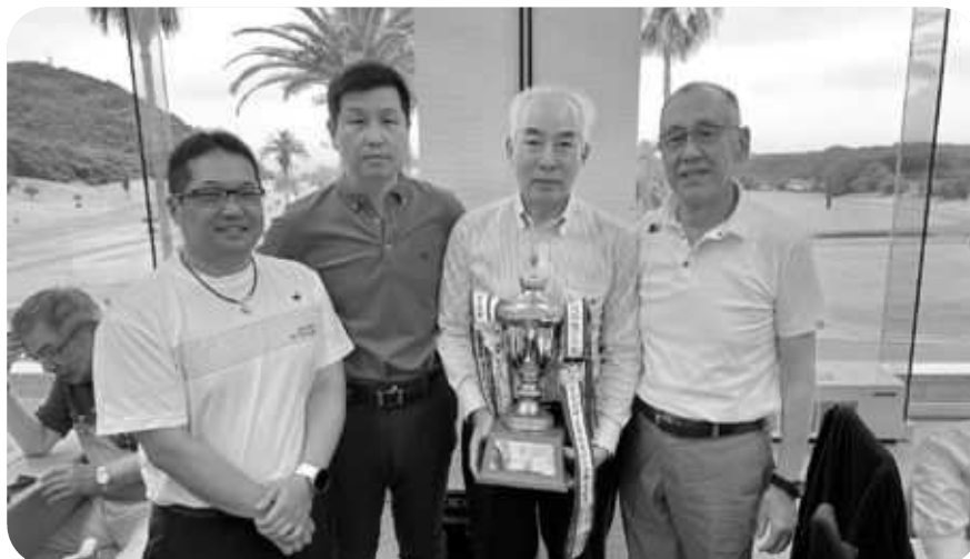
団体戦は愛媛県チームが優勝