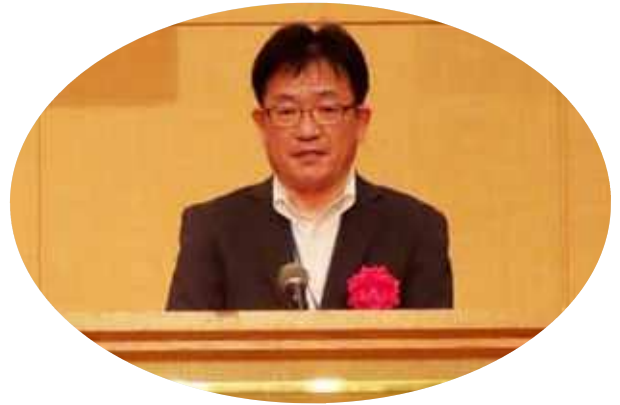
来賓祝辞 高知市長（代理 税務長）