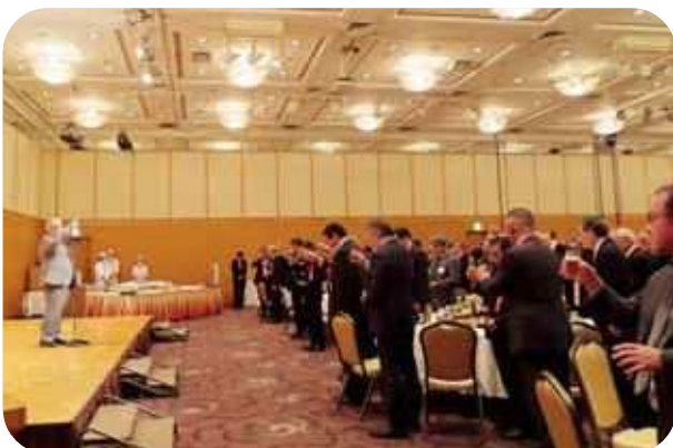
高松国税不服審判所長による乾杯