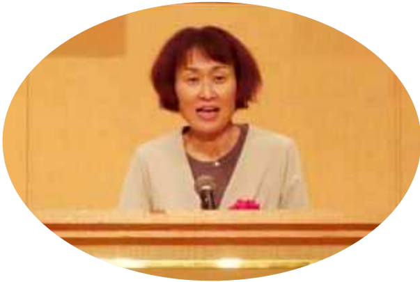
来賓祝辞 高知県知事（代理 税務課長）