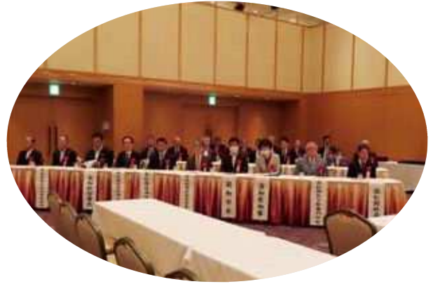
定期総会出席のご来賓