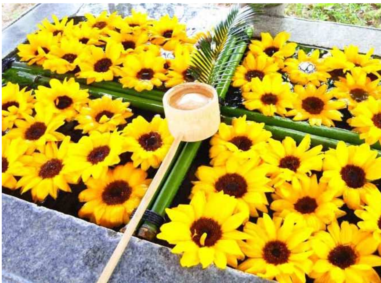
坂本八幡神社の「花手水」

●発行人 / 浜崎 友二 ●編集人 / 秋山 千枝 ●ホームページ / https://www.shikoku-zei.or.jp