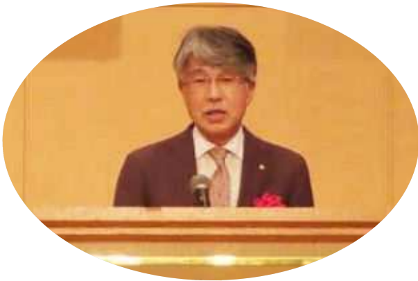
来賓祝辞 日税連会長（代理 副会長）