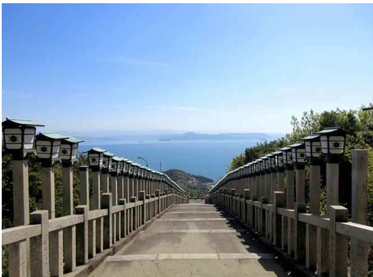
小豆島霊場 42番 西ノ滝から 屋島、五剣山を望む 撮影者 土庄支部 岡 英一

●発行人 / 浜崎 友二 ●編集人 / 秋山 千枝 ●ホームページ / https://www.shikoku-zei.or.jp