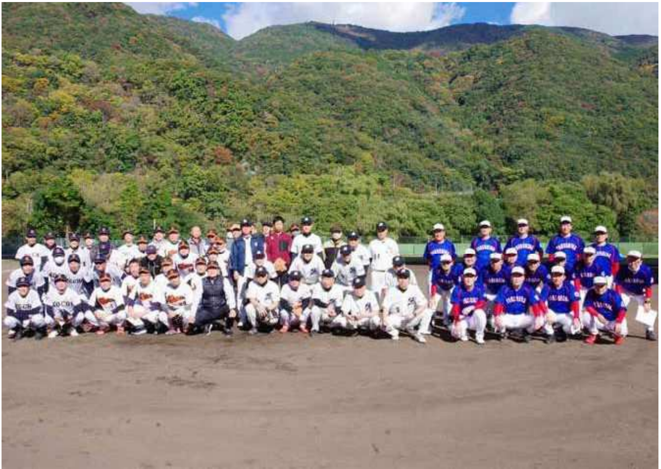
県別対抗ソフトボール大会

●発行人 / 浜崎 友二 ●編集人 / 秋山 千枝 ●ホームページ / https://www.shikoku-zei.or.jp