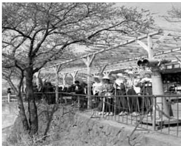
屋島山上西側から高松市街地を望む （たくさんの人が観光に訪れていました）