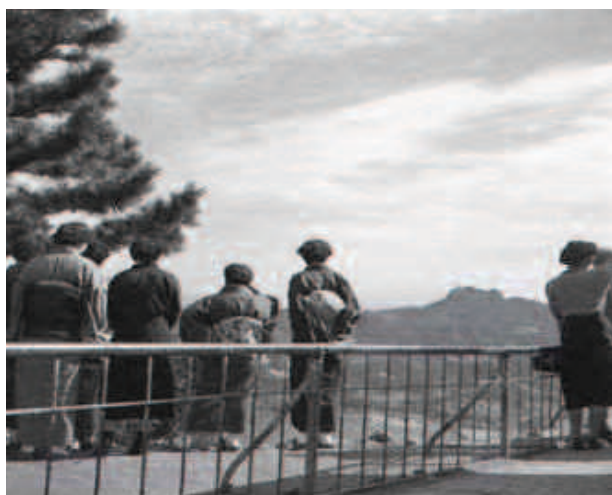
屋島山上東側から五剣山（八栗山）を望む