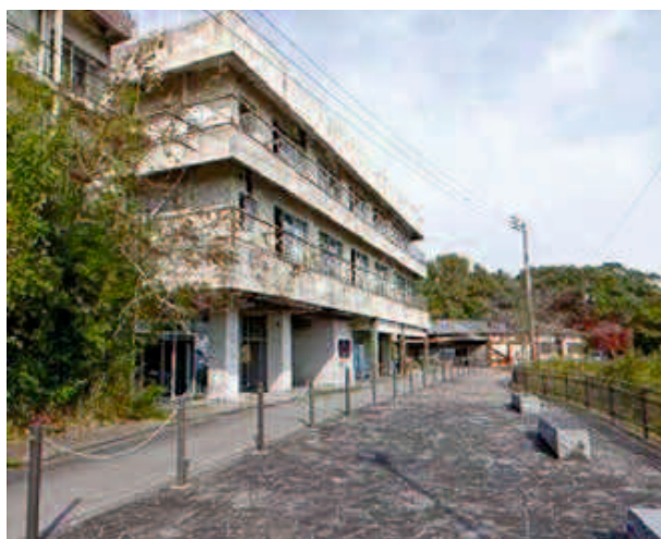
→ 今は廃墟のホテルと土産物店が（撮影日は廃墟のホテルで猫ちゃんが日向ぼっこを！）