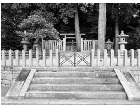
崇徳天皇陵（白峰御陵）

春は桜、夏は紫陽花、秋は紅葉が楽しめます。こちらも機会があれば訪れてみてはいかがでしょうか。