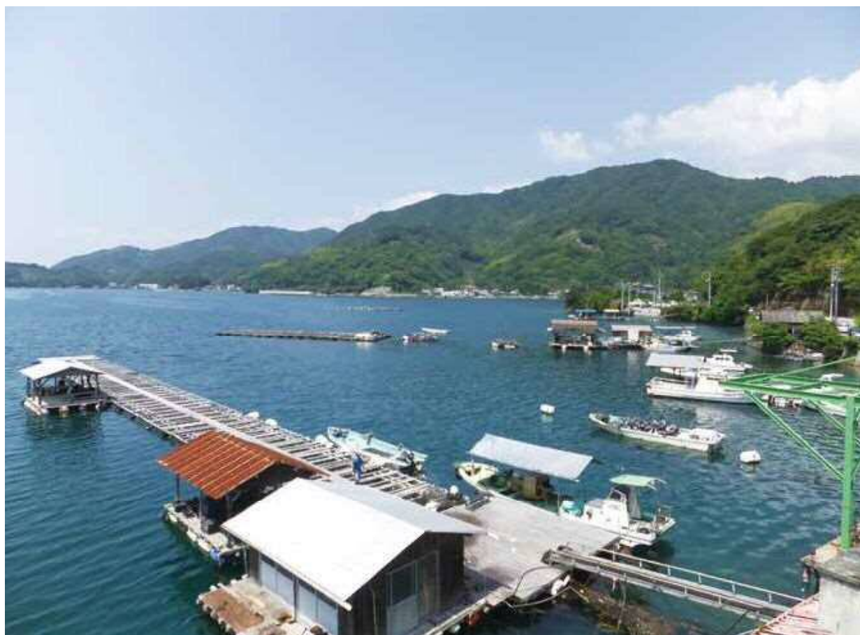
真珠養殖場の風景

●発行人 / 清田 明弘 ●編集人 / 松岡 真澄美 ●ホームページ / http://www.shikoku-zei.or.jp